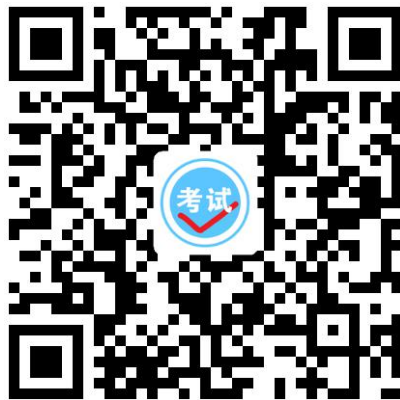
竞赛考场专用二维码